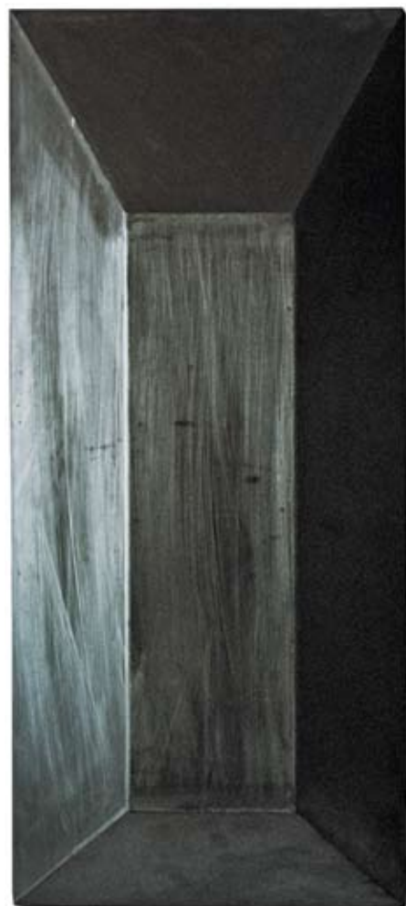
Triptych "City", stainless steel, 89x30x5, 2005

While I studied in Düsseldorf (Germany) I did a lot of research of the city. I thought it should be marked somehow, hence the idea for this project. On the city map I marked my every route, day-in day-out. The project lasted from March 27 till December 14 2005 or 164 days to be more precise, with one interruption while in Belgrade. A straight-line drive from point A to point B is marked too.