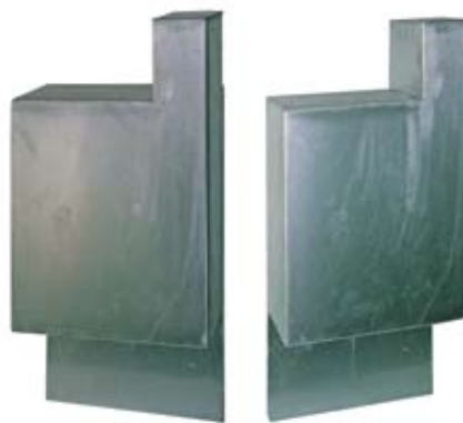
Triptych "City", stainless steel, 51x27x14, 2005