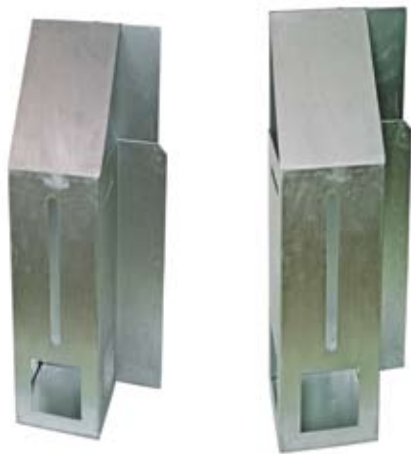
Triptych "City", stainless steel, 71x29x18, 2005