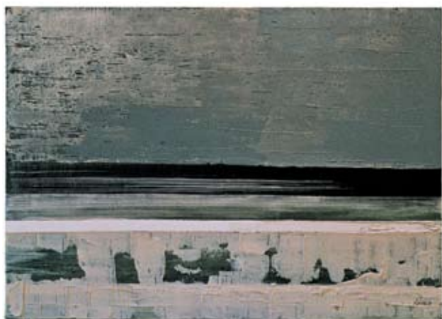
acril on canvas, 70x50, 2008