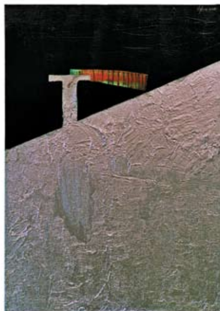
acril on canvas, 70x50, 2008

Galerija „Podest“ Dom omladine, Beograd Galerija Kulturni centar „Laza Kostić“, Sombor