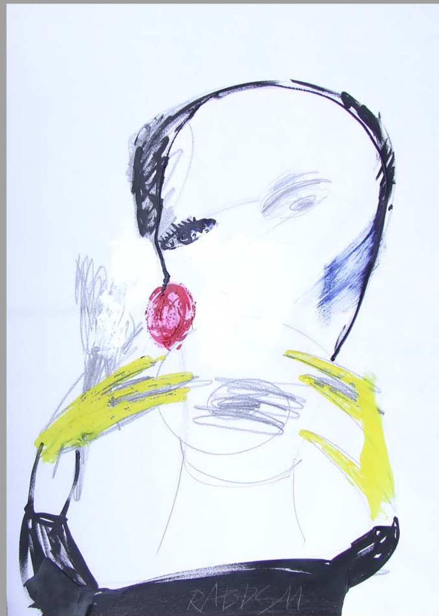
Portret sa plavim, kombinovana tehnika, 2017, 50x70cm